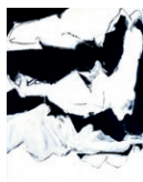
17. JACQUES HURTUBISE, IL Y EUT UN BLANC , 1963, ACRYLIQUE SUR TOILE, 179 X 126,8 CM, MNBAQ, ACHAT (1969.208) © SUCCESSION JACQUES HURTUBISE / SODRAC (2016)