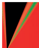
6. RITA LETENDRE, IN SPACE , 1969, SÉRIGRAPHIE, 66 X 50,8 CM, MNBAQ, DON ANONYME (2004.372) © RITA LETENDRE