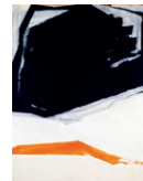
28. JACQUES HURTUBISE, AGONIE , 1964, ACRYLIQUE SUR TOILE, 177,4 X 125,5 CM, MNBAQ, DON DE PATRICE ET ANDRÉE DROUIN (1988.124) © SUCCESSION JACQUES HURTUBISE / SODRAC (2016)