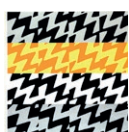
12. JACQUES HURTUBISE, JANETTE , 1969, SÉRIGRAPHIE, 72,4 X 57,2 CM, MNBAQ, ACHAT (1970.50) © SUCCESSION JACQUES HURTUBISE / SODRAC (2016)